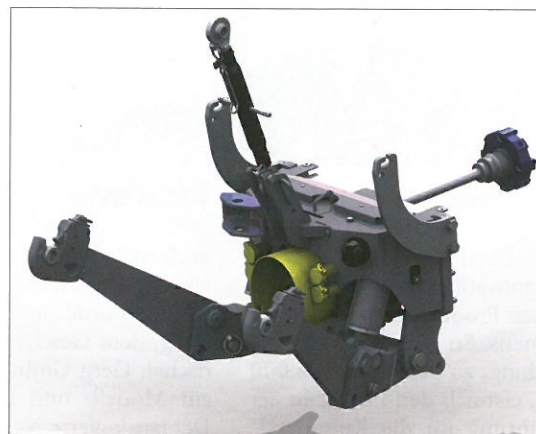
Fronthydraulik und Frontzapfwelle für den Claas Arion 400.