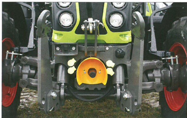
Das Zuidberg Frontsystem für den Arion 400 gestaltet sich sehr kompakt.