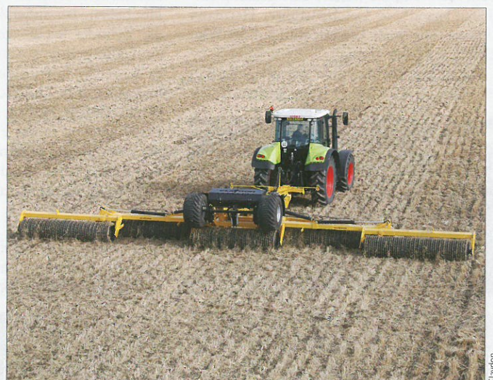
Ab sofort bietet Claydon auch eine schwere Cambridge-Walze an, die speziell für das Claydon Strip Till Verfahren optimiert wurde.

Claydon Yield-o-Meter Ltd. Wickhambrook, Suffolk, CB8 8YA (GB) Axel Behmann Tel. 0049 (0) 45 55-71 42 16 Mobil 0049 (0)1 71-1 90 42 08 www.claydondrill.com